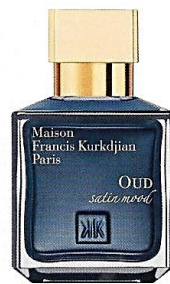
4 OUD SATIN MOOD, MAISON FRANCIS KURKDJIAN RM938.10, 70ML

Sesiapa yang sudah biasa mewarnakan rambut sedar bahawa ia boleh menyebabkan rambut lebih kering dan kasar. Itu gunanya Pureology. Pureology dirumuskan daripada ramuan-ramuan botanikal dan adalah 100 peratus vegan . Rahsia produk ialah Golden Marul Oil, yang diekstrak dari kacang Mural di kawasan pedalaman Afrika, dan berkuasa untuk memberi penghidratan, perlindungan dan penyegaran yang optimum.