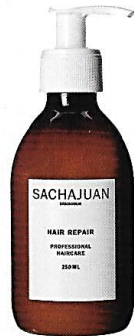
2 SACHAJUAN HAIR REPAIR PROFESSIONAL MOUSSE RM52, 100ML RM105, 250ML RM264, 1000ML

Dengan cuaca yang kian panas sebegini, bibir saya pun cepat kering. Sedar akan dilema saya, teman pun mengesyorkan pelembap bibir ini. Diibaratkan "bantak gebu" untuk bibir, produk ini melembapkan dan melindungi bibir daripada kesan-kesan alam sekitar. Jika dipakaikan sebelum tidur, ia merapi dan mengembalikan kelembutan. Datangnya pagi, bibir kekal sihat dan licin sebaik sahaja bangun daripada tidur.