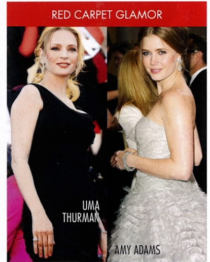
RED CARPET GLAMOR