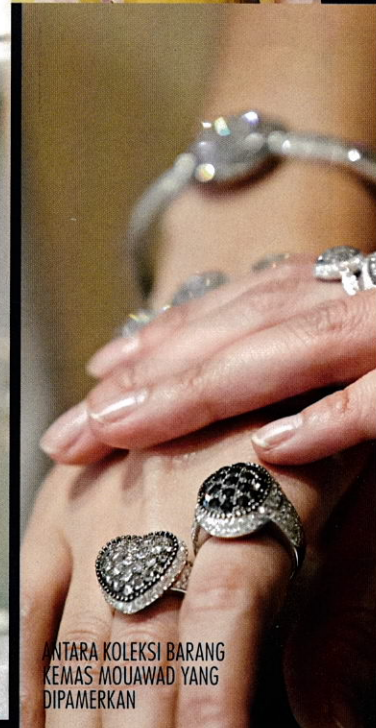
ANTARA KOLEKSI BARANG KEMAS MOUAWAD YANG DIPAMERKAN